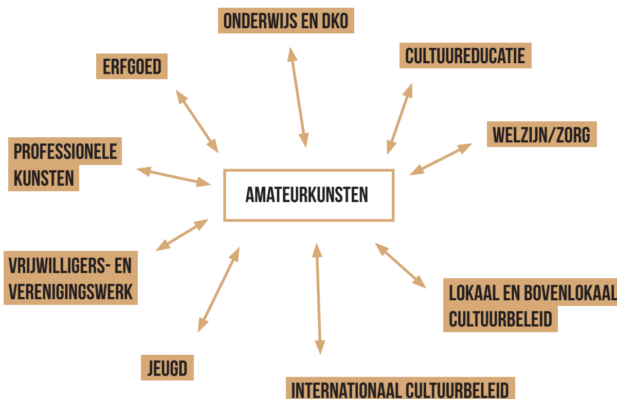
Figuur 2: aanverwante sectoren en beleidsdomeinen

Omdat deze aanverwante sectoren natuurlijke partners zijn, is het belangrijk dat het amateurkunstendecreet de ruimte laat om als organisatie en/of praktijk sectoroverschrijdend te kunnen werken en dit idealiter ook stimuleert. Het amateurkunstendecreet is een decreet dat zijn tentakels moet uitstrekken naar andere beleidsdomeinen. Of zoals het Forum voor Amateurkunsten het reeds omschreef in de nota "DNA van de amateurkunsten":